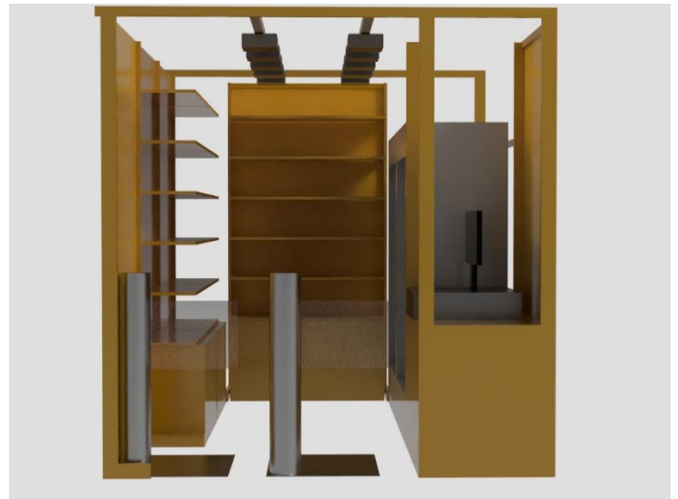
TTG-SENSE MICRO イメージ