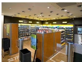
①入店後、欲しい商品を手にする

商品を手に取り、出口でディスプレイの表示内容を確認し、支払いするだけでお買い物が完了します。