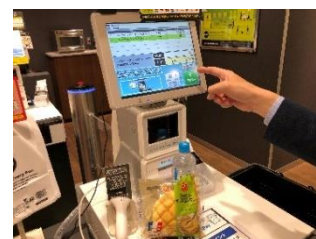
③出口のディスプレイで購入商品を確認して決済