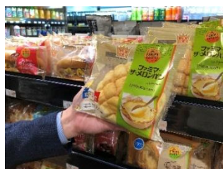
②商品は手持ちのバッグに入れても OK