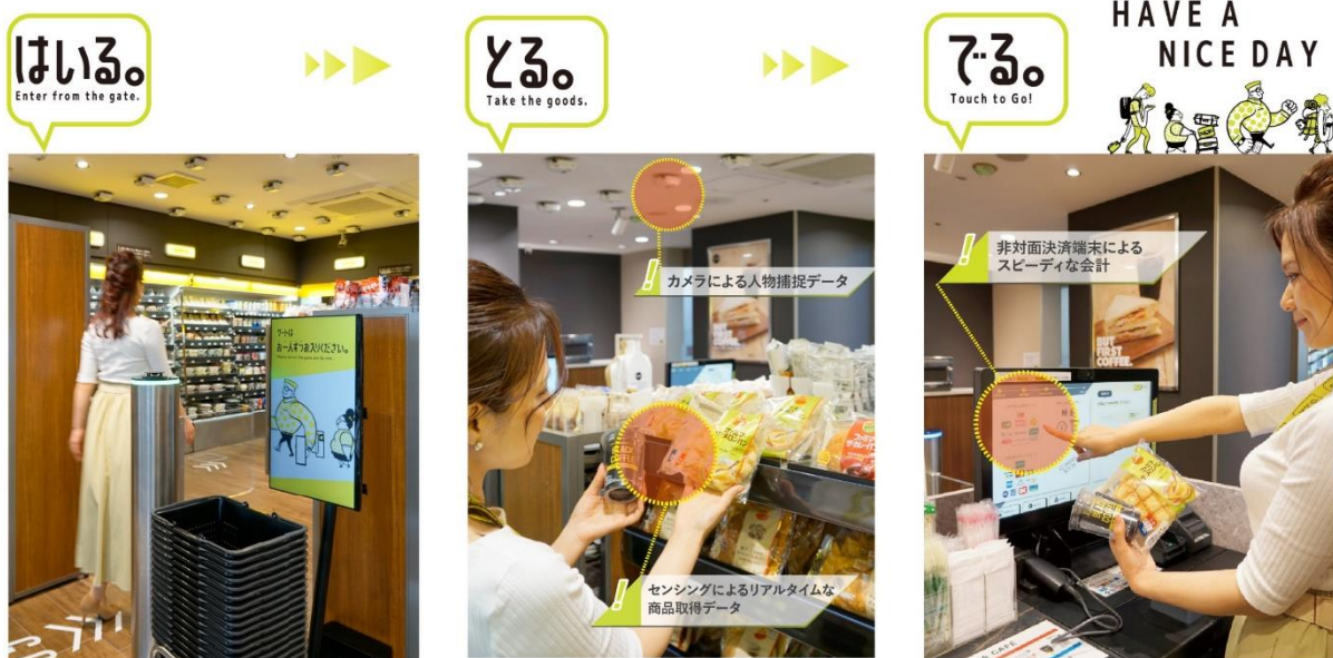
<ご利用の流れ（他社事例）>

わずか7平方メートルのスペースでも導入可能なこのシステムは、コンビニやオフィス、さらには病院やガソリンスタンドといった様々な場所での利用が想定されています。この革新的なソリューションは、事業者とお客様双方に今までにない利便性を提供します。