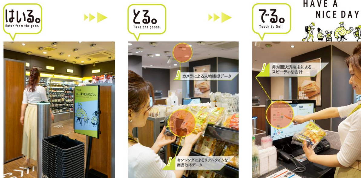
<ご利用の流れ（他社事例）>

「TTG-SENSE MICRO」は、省スペース、ローコストの無人決済システムです。約 7㎡の狭小スペースでも展開が可能のため、コンビニエンスストア、お土産・雑貨店、オフィス（職域売店）等での展開に加え、病院、ガソリンスタンド、工場等の共用部・休憩室などでも事業展開を可能にし、事業者、お客さまの双方に利便性を提供できる新たなソリューションとなっています。