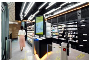
① 欲しい商品を手にする

商品を手に取り、出口でタッチパネルの表示内容を確認し、支払いをすることでお買い物が完了します。