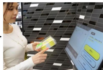
③ 出口のディスプレイで購入商品を確認して決済