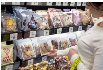
② 商品は手持ちのバックに入れても OK